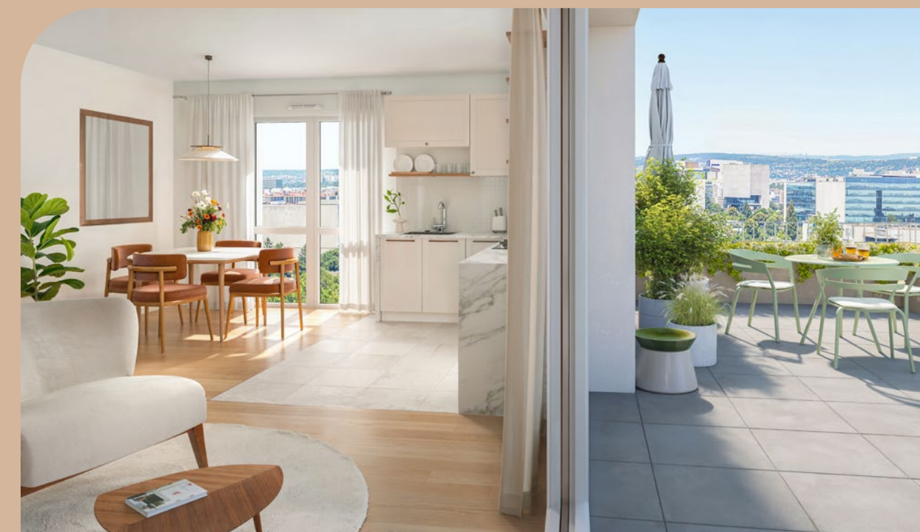
Exemple d'un appartement 3 pièces