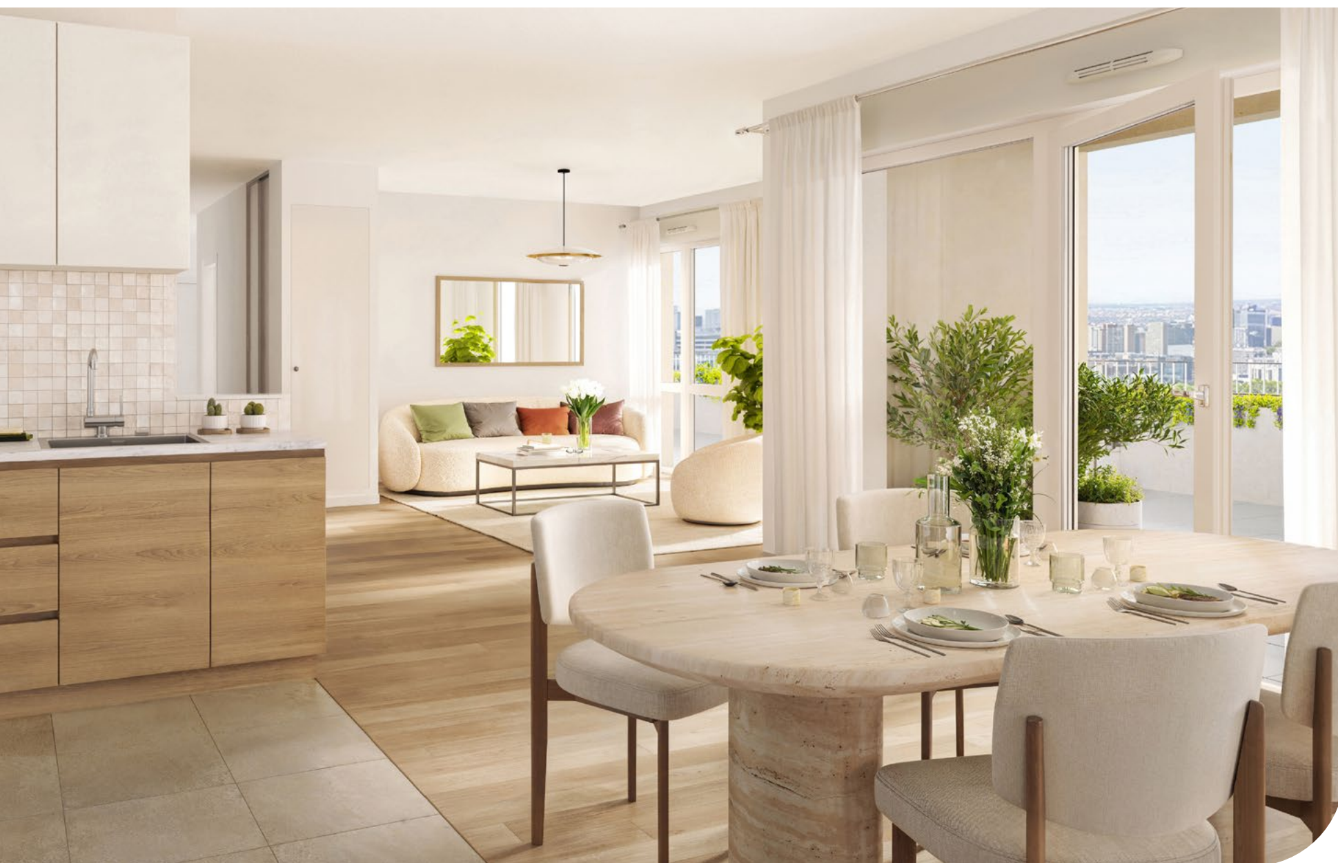
Exemple d'un appartement 4 pièces

Enfin, des prestations de qualité et des performances énergétiques soignées assurent un confort durable.