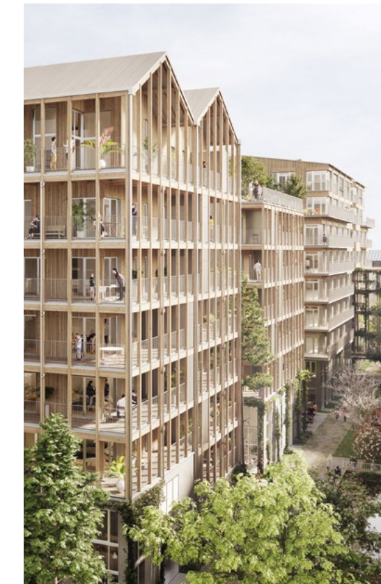
ILOT BERGERON - NANTES Architecte : Alexandre Chemetoff