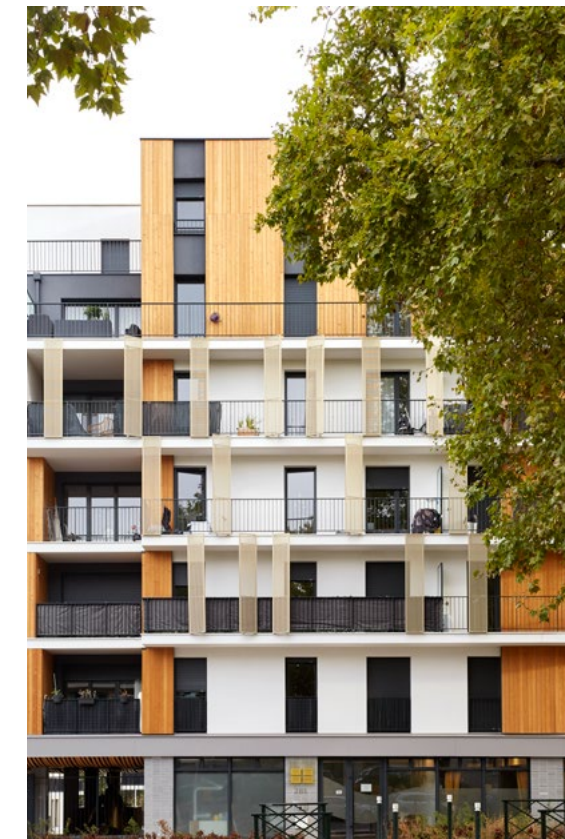
1 RUE DE CRAIOVA - NANTERRE Architectes : Agence Gérard de Cussac